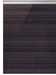
アルベロブラック(鏡面)