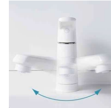
吐水部を左右に首振りできま す。(画像はスコビカタイプ)