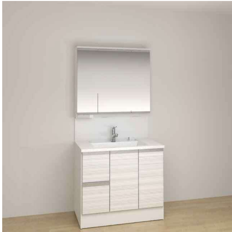
※画像はイメージです。組合せなどはお見積書をご確認ください。