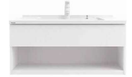
フロートオープンタイプ