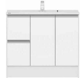
引出しタイプ (画像は幅900サイズ)