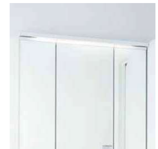
薄型のLED照明で空間すっきり。省 エネ・長寿命を実現しています。