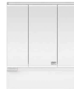
スリムLED3面鏡 ミドルパネル 900