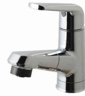
マルチシングルレバーシャワー (メタルタイプ)(エコカチットあり) ※シャワーヘッドは引き出せます。