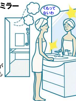
※3面鏡はセンターミラーのみ、2面鏡はメインミラーのみ。

電気代ゼロで、全面クリア。 新感覚のミラーです。 鏡の表面に、吸水性・親水性の ある膜をコーティング。 狭い部分しか効果のなかった 従来品(ヒーター)に対し、全面が くもりにくいので、お風呂上がりも 鏡はいつもクリア。電気代も かからないので経済的です。