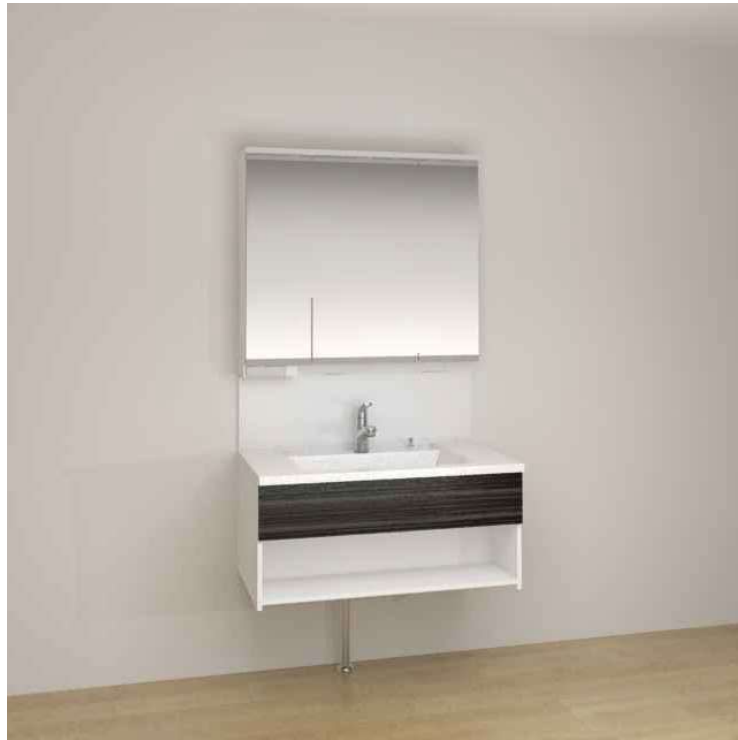
※画像はイメージです。組合せなどはお見積書をご確認ください。