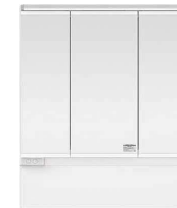
スリムLED3面鏡 ミドルパネル 900