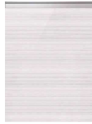
アルベロホワイト(鏡面)