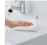
水に濡れた物を置くのに便利な ウェットエリア。継ぎ目や隙間がなく、 汚れてもささっと拭くだけ。