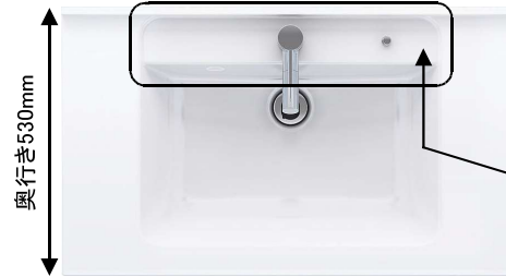
(画像は幅900mm) ●ボール深さ:165mm 容量:12L