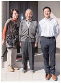
「営業さんと対話を重ね理想の住まいとなりました」