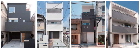
敷地面積 / 14.91坪 1000万円台～1500万円台 敷地面積 / 15.86坪 1000万円台～1500万円台 敷地面積 / 11.22坪 1000万円台～1500万円台 敷地面積 / 18.57坪 1500万円台～2000万円台