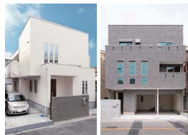
敷地面積 / 49.64坪 2500万円台～3000万円台 敷地面積 / 42.95坪 3000万円台～3500万円台