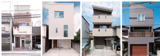
敷地面積 / 23.68坪 2000万円台～2500万円台 敷地面積 / 25.7坪 2000万円台～2500万円台 敷地面積 / 20.87坪 2000万円台～2500万円台 敷地面積 / 20.93坪 2500万円台～3000万円台

上層部分がせり出したオーバーハングや、開口の大きいラゲージなども容易に実現できるので、多彩なプランで空間を有効に活用することができます。まずは同社に相談してみよう