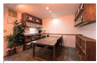
多数の施工例も閲覧することができる

担当者が直接訪問して対応してくれるので、建築中はもちろん建てた後まで安心。もちろん事務所でも設計相談も可能。重量鉄骨の構造も確認できるので気軽に訪れよう。